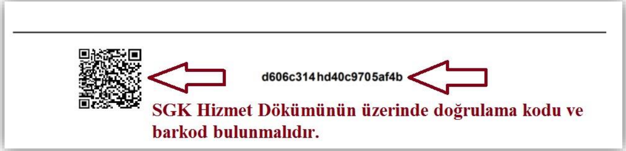
Resim 3- SGK Hizmet Dökümü örneği

suretiyle işçi statüsünde bilişim personeli olarak geçtiği belgelenen hizmet süreleri dikkate alınır. Mesleki tecrübe sürelerinde; başvuru pozisyon ile ilgili lisans mezuniyeti lisans mezuniyeti sonrasındaki hizmetler dikkate alınacaktır. Üzerinde doğrulama kodu ve barkod bulunan e-devletten alınan “SGK Hizmet Dökümü” mesleki tecrübeyi gösteren belge olarak kabul edilecektir.