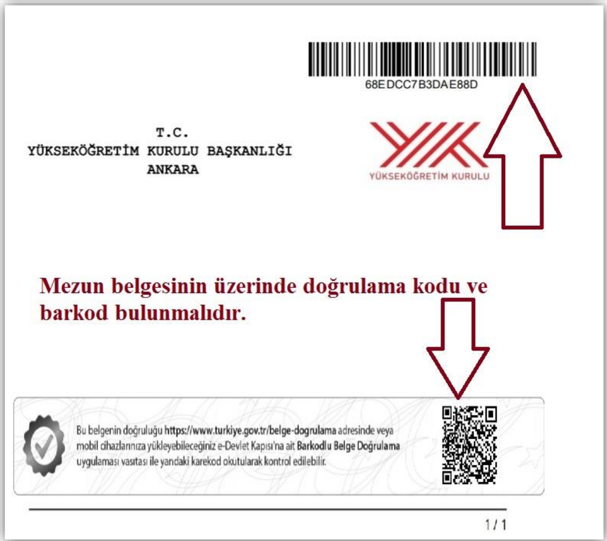
Resim 2- Mezun belgesi örneği

f) Diploma Denklik Belgesi: Eğitimini yurtdışında tamamlamış ya da yurtdışında bulunan üniversitelerden mezun olan adaylar diploma denklik belgesinin aslını veya aslına uygunluğu noterce onaylanmış örneğini ibraz etmelidir.